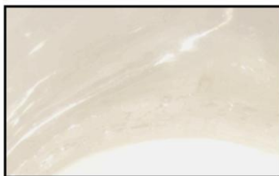
Vitt plastkärl efter rening